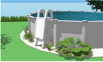
Piscine hors terre avec échelle munie d'une portière de sécurité qui se referme et se verrouille automatiquement.

Veillez sélectionner le type de projet de piscine concerné par votre demande :