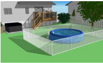
Piscine hors terre (moins de 1,2 mètre de hauteur), gonflable ou à parois souples (démontable) complètement clôturée.