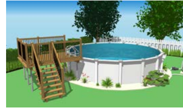
Piscine hors terre avec plateforme munie d'une enceinte de protection.