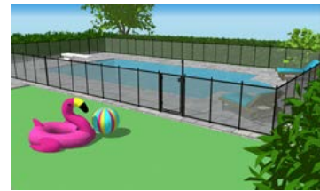
Piscine creusée complètement clôturée.

Autre type d'enceinte de protection. Fournir des plans de l'aménagement.