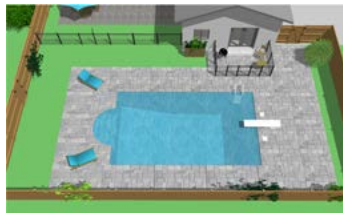
Piscine creusée clôturée avec balcon muni d'une enceinte de protection.