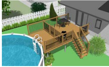
Piscine hors terre avec terrasse munie d'une enceinte de protection.