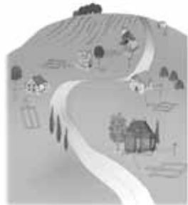
Figure A2 : L'assainissement autonome

Dans les zones rurales, la faible densité d'occupation du territoire, la grandeur des terrains ainsi que la capacité d'épuration et d'évacuation du terrain naturel permettent d'assainir les eaux usées par des équipements implantés sur chaque terrain, les installations septiques.