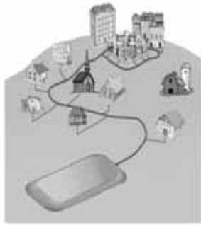
Figure A1 : L'assainissement collectif

Dans les zones urbaines, les villages, la ville, là où la densité de la population le justifie, les eaux usées sont canalisées vers des ouvrages de traitement collectifs, les étangs d'épuration des eaux usées.